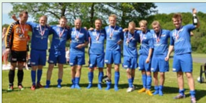
Senior, Odense vandt seniorrækken