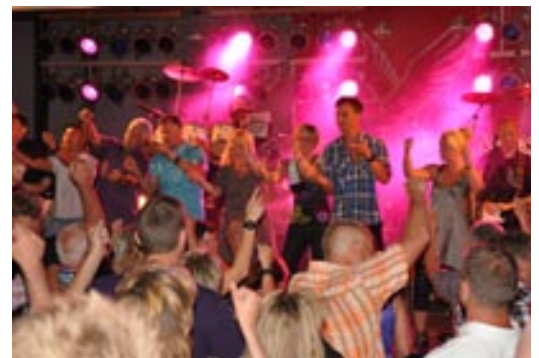
Dansegulvet blev hurtigt taget i besiddelse