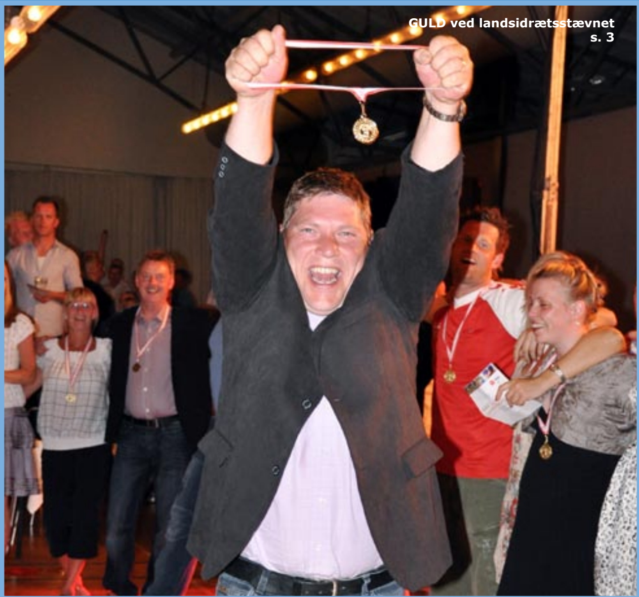
GULD ved landsidrætsstævnet s. 3

PERSONALEFORENINGENS BLAD • NR. 3 • JUNI • 2010 • 67. ÅRGANG