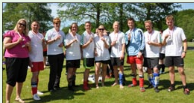
Mix, vundet af Skive