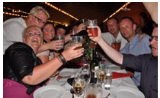
Gode venner mødes altid til Falck-sports landsidrætsstævner